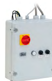
CUADRO ESTRELLA TRIÁNGULO INCLUIDO EN MODELOS DE 10 HP

Tubo colector diseñado para mejorar la refrigeración del aire a la entrada de la caldera