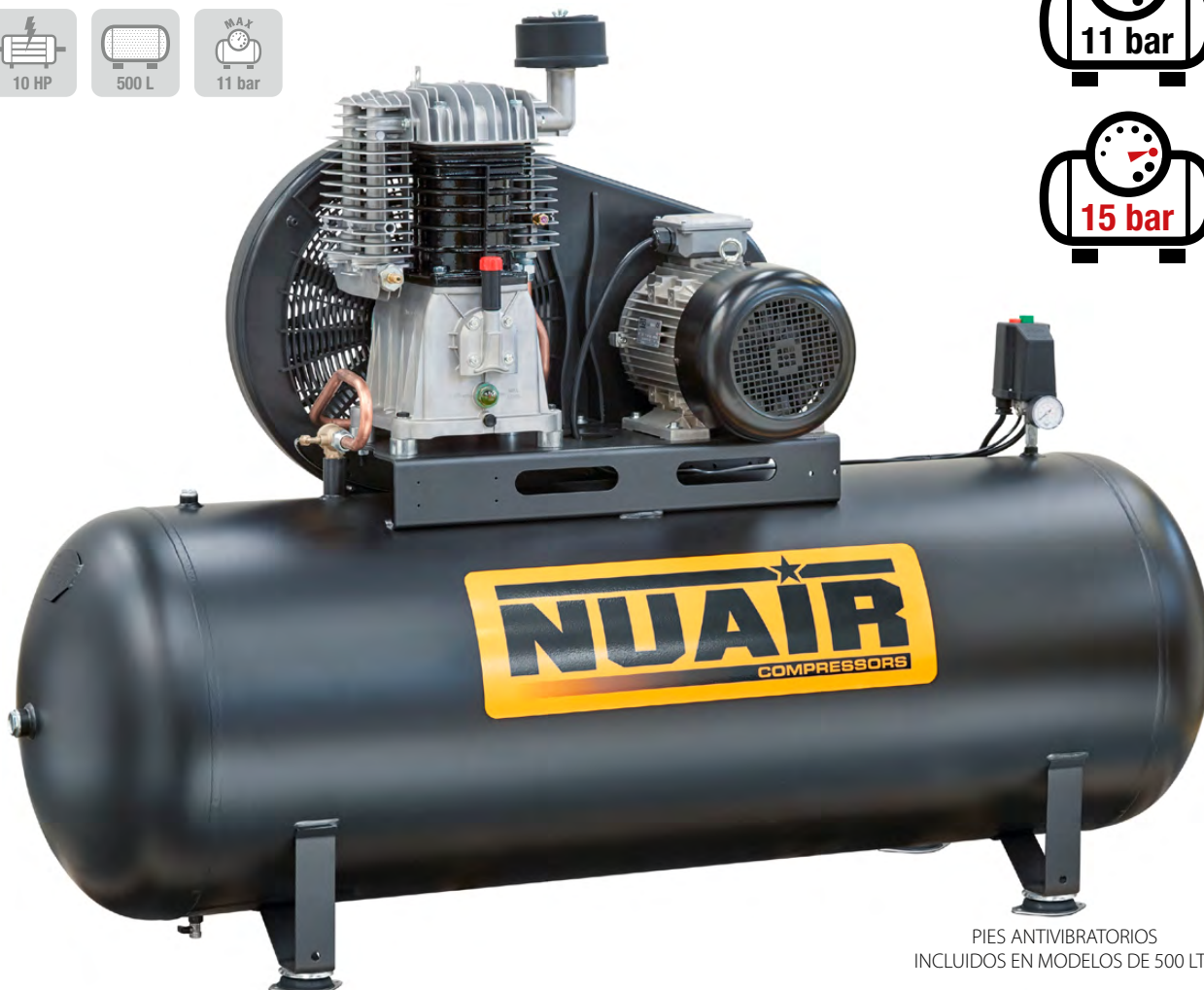
PIES ANTIVIBRATORIOS INCLUIDOS EN MODELOS DE 500 LTS